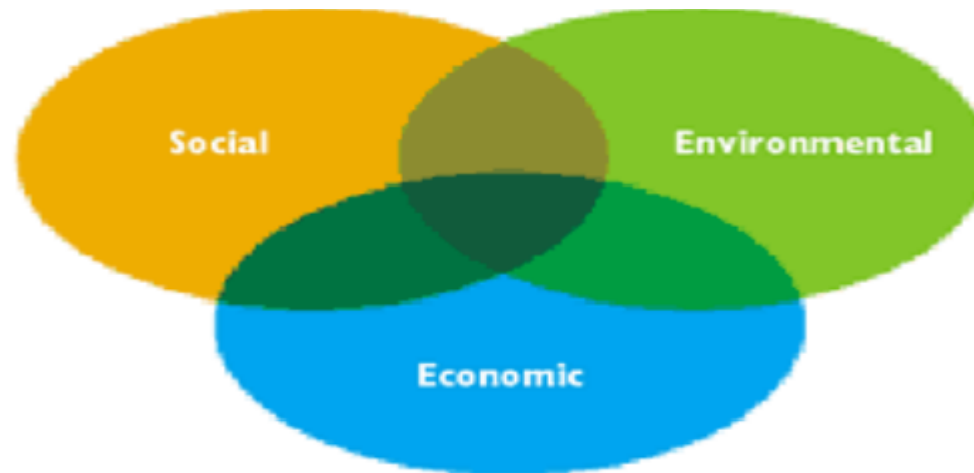
Слика 1: Показува како овие три димензии се поврзани и се преклопуваат.

КОО може да се претстави преку три димензии - социјална, еколошка и економска – кои се во согласност и со трите димензии на она што се нарекува Triple bottom line: луѓе, животна средина и профит.